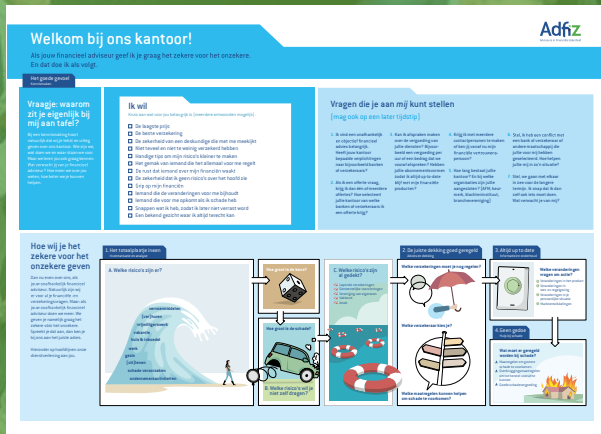
INFOGRAPHIC WAARDE VAN ADVIES